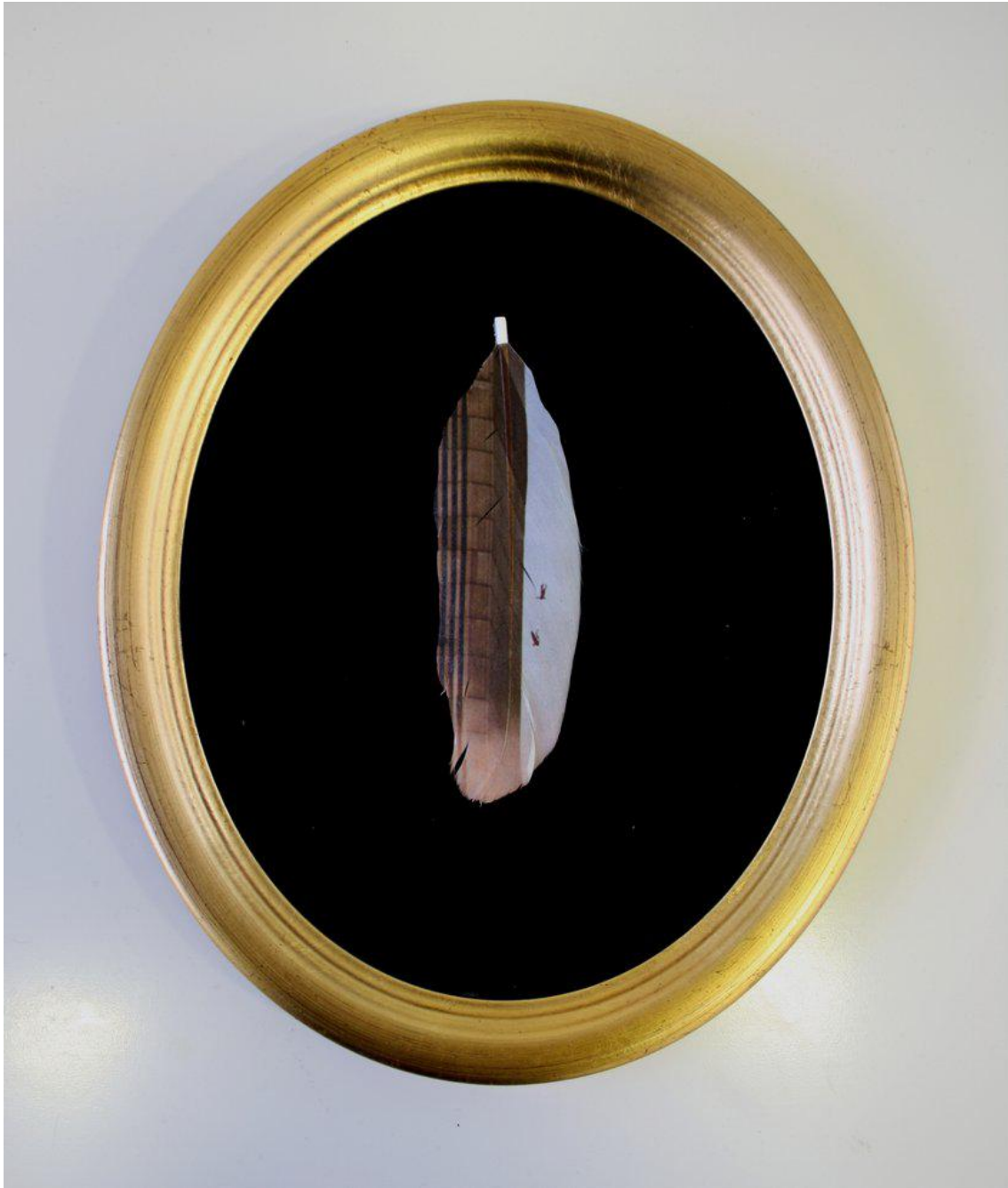
El icaro del siglo XX

Impresión inkjet con tintas UVI sobre pluma de pato, marco dorado y cristal de museo